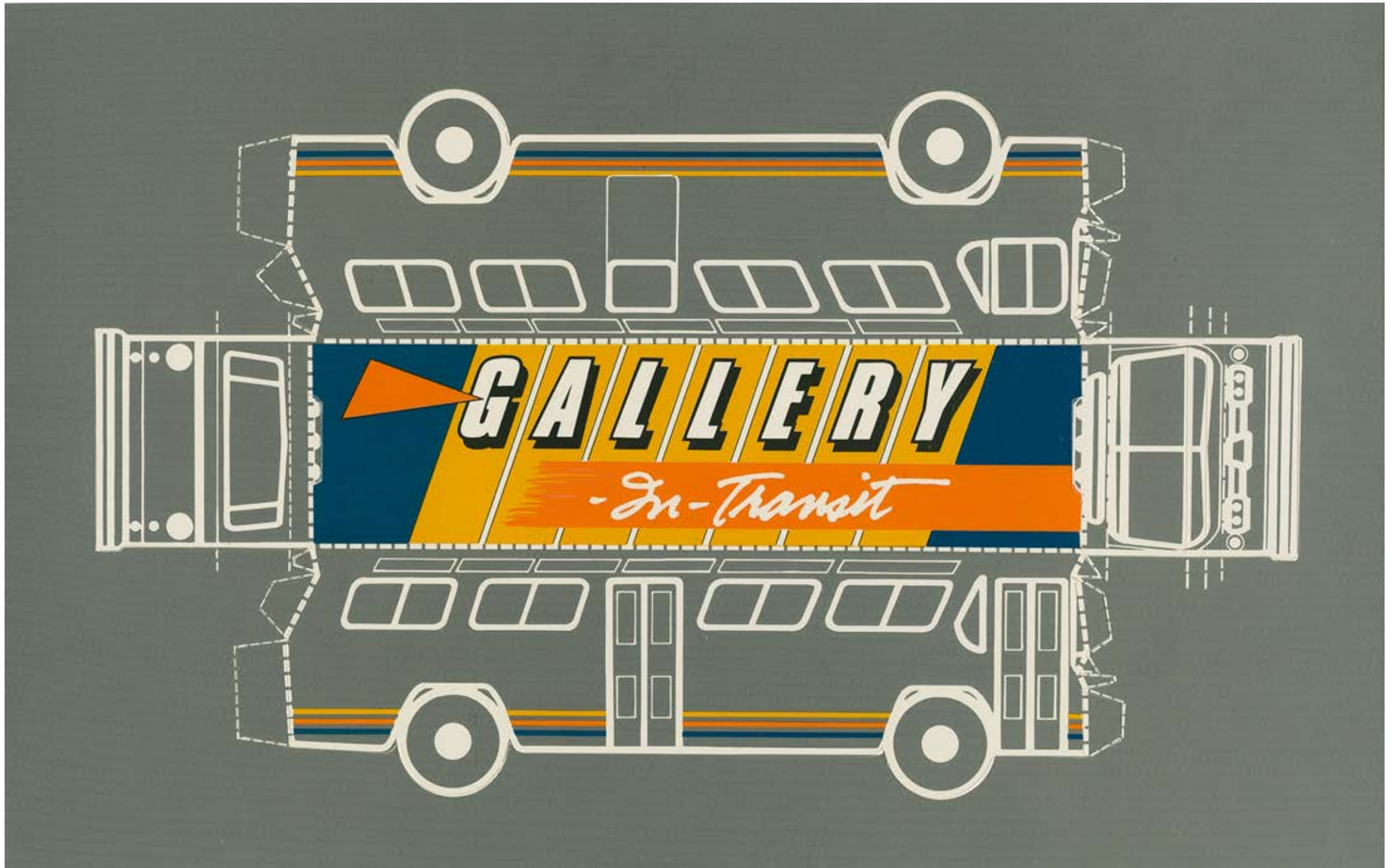
19840600 Gallery In Transit Catalogue Cover